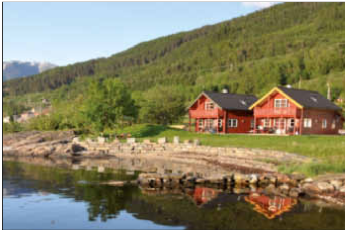
Norwegen mit seinen 57.000 Kilometer Küstenlänge ist ein wahrer Traum für alle Angler.