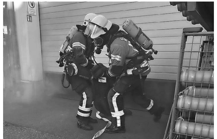
Trupp bei der der Menschenrettung (hier mit einer Übungspuppe)