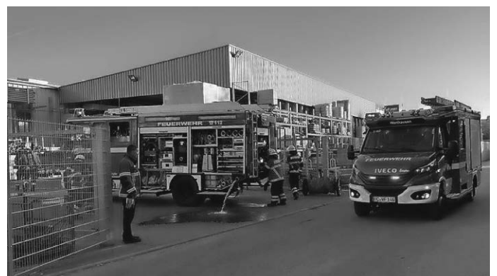
LF16/12 und MLF