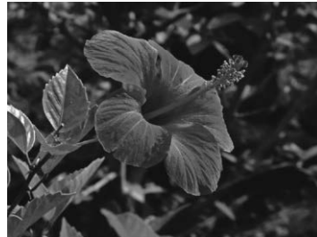
Die Nationalblume von Vanuatu ist der Hibiskus.

Der Inselstaat ist eines der Länder, das am stärksten vom Klimawandel bedroht ist. Zyklone mit Windgeschwindigkeiten von 280 km/h zerstören in einer Nacht bis zu 90 Prozent aller Häuser einer Insel. Und der Meeresspiegel steigt unaufhörlich. Dazu gibt es einige Vulkane und regelmäßig Erdbeben. Das Opfer des Weltgebetstages kommt einem Ausbildungsprogramm für junge Frauen zugute, damit sie lernen die englischen oder französischen Wettervorhersagen in die vielen einheimischen Sprachen übersetzen und so die Menschen vor Ort informieren können.