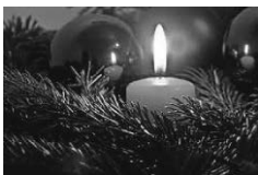
Licht im Advent