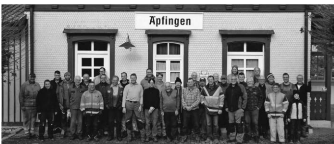
Text und Foto: Benny Bechter

Die Mitglieder des Öchsle Schmalspurbahn e.V. kümmern sich ganzjährig um den Erhalt der Öchsle Strecke. Wer hierbei mithelfen möchte ist jederzeit herzlich eingeladen. Weitere Informationen unter: verein@oechsle-bahn.de