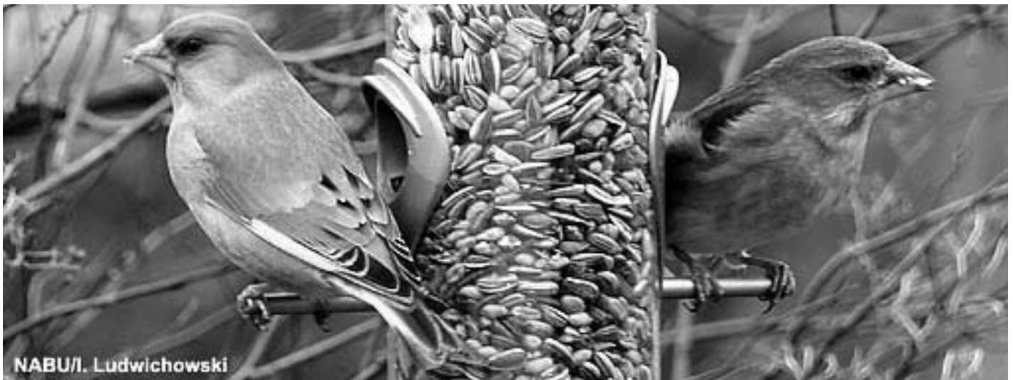
Grünfinkenpaar am Futterautomat.