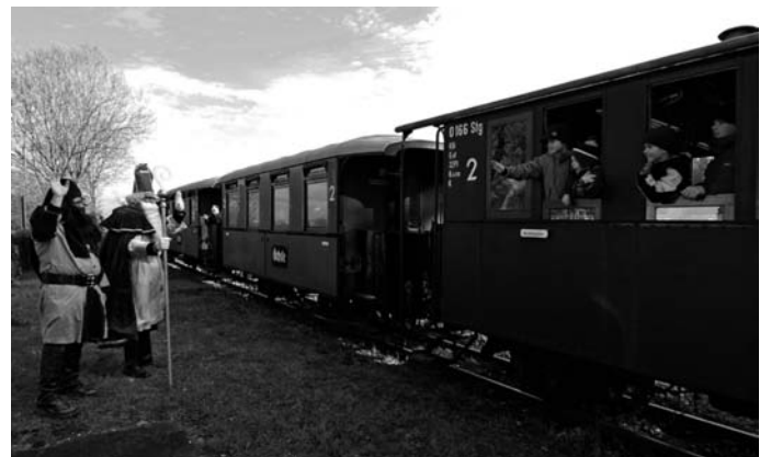
Begegnungen mit dem Nikolaus gibt es am zweiten Adventswochenende in den historischen Wagen der Öchsle-Bahn.

INFO: Abfahrt zu den Winterdampffahrten am 30. November ist ab Warthausen um 16 Uhr, ab Ochsenhausen um 19.30 Uhr; am 1. und 2. Dezember ab Warthausen um 11 und 14 Uhr, ab Ochsenhausen um 12.30 und 17.30 Uhr. Die Nikolausfahrten starten am 6., 8. und 9. Dezember um 11 Uhr, 14 Uhr und 17 Uhr in Warthausen. Für die Nikolausfahrten sind Anmeldungen erforderlich, für die Winterdampffahrten empfohlen. Informationen und Reservierungen beim Verkehrsamt Ochsenhausen, Telefon 07352/922026, sowie im Internet unter www.oechsle-bahn.de .