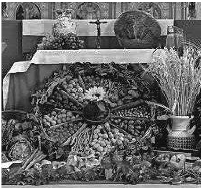
Erntedank in Warthausen