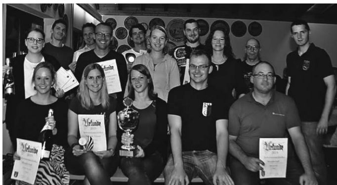
Sieger des Jedermannschießen 2019

An dieser Stelle noch einmal vielen Dank an alle Besucher der Metzelsuppe & an alle Teilnehmer des Jedermannschießen. Die Ergebnisse des Jedermannschießen können auch unter www.schuetzenverein-birkenhard.de abgerufen werden!