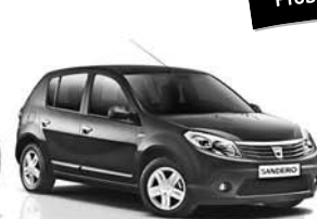
Dacia Sandero 6.990 € 5