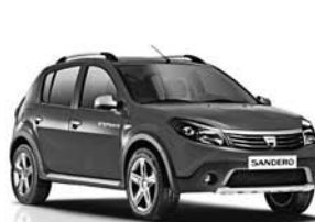
Dacia Sandero Stepway 9.990 € 4