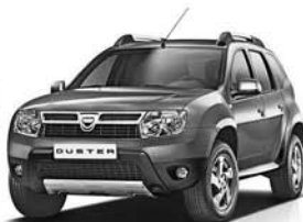
Dacia Duster 4 x 4 13.890 € 3