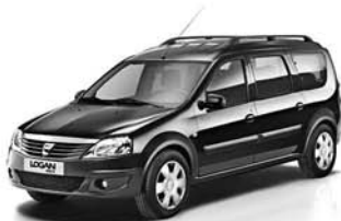
Dacia Logan MCV 7.990 € 2