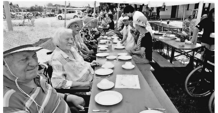
Die Seniorinnen, Senioren und ...

Ein Dank an den Kleintierzuchtverein für seine Gastfreundschaft und wie stets an dieser Stelle: Immer wieder gerne!