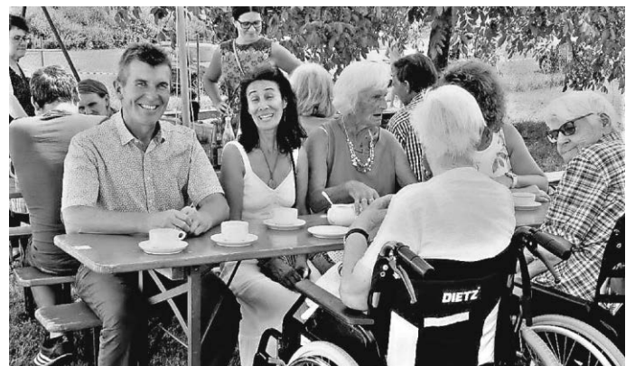
... alle Helfer sagen Danke!