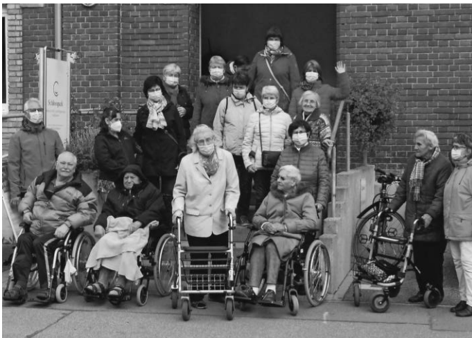
Dann mal ab - auf große Tour!