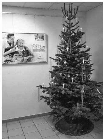
Ein prächtiges Bäumchen ...

Seit Jahren ist ein fester Bestandteil im Jahresprogramm des Fördervereins Pflegeheim Schlosspark Warthausene.V., für die Bewohnerinnen und Bewohner der Einrichtung einen Weihnachtsbaum festlich zu schmücken und damit auf das nahende Fest einzustimmen. Diese Tradition konnte trotz der bestehenden Einschränkungen auch zum Ende des Jahres 2020 fortgeführt werden.