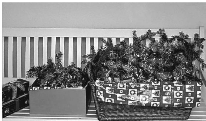
und eine leckere Spende

Die zu diesem Zeitpunkt bestehenden Beschränkung ließen es leider nicht zu, den Weihnachtsbaum in gewohnter Weise im Foyer des Hauses zu schmücken. So wurde Mitte Dezember ein prächtiger Baum besorgt und von wenigen Helfer*innen des Fördervereins in gebührendem Abstand im Freien geschmückt. Mit tatkräftiger Unterstützung der Haustechnik gelangte der Baum schließlich in den Eingangsbereich des Hauses, wo er nun im gewohnten Glanz erstrahlt.