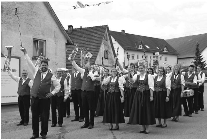
Umzug Adelindis Kinder- & Heimatfest in Bad Buchau

Vergangenen Sonntag, 17. Juni präsentierte sich der Musikverein Warthausen beim Umzug des Adelindis Kinder- und Heimatfest in Bad Buchau. Trotz schwüler Temperaturen hatten die Musikerinnen und Musiker sichtlich Spaß und konnten dabei ihr Können am Marschieren unter Beweis stellen.