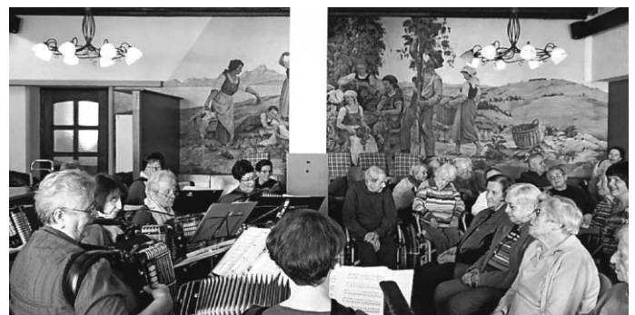
Freude schenken und ...

Erneut fanden die virtuoson Damen des Senioren-Harmonikaorchesters Biberach den Weg ins Charleston Wohn- und Pflegeheim Warthausen, um unseren betagten Seniorinnen und Senioren akustisch den Vormittag zu versüßen. Der Einladung des Förderverein kamen sie gern nach – sind diese Gastspiele doch mittlerweile auch für sie eine Herzensangelegenheit und verbinden in perfekter Weise ihre Orchesterproben mit der Möglichkeit, Freude und Wärme zu schenken. Der „ Wack're Schwabe “ bebte erneut unter dem Beifall der zahlreich erschienenen Seniorinnen und Senioren, die bei den wohlbekannten Klängen mitsangen und mitkatschten. Der Anerkennung aller, die diese wundervolle Stunde genießen durften, gilt den Damen des Orchesters, deren unerschöpfliches Repertoire durch die Klangwelt ihrer Akkordeons, bei Alt und Jung kein Auge trocken ließ. Nach dem Konzert und vor ihrer Heimreise durften sich die Akteure und Helfer noch bei anregenden Gesprächen mit Kaffee, Brezeln und Kuchen stärken. Das schlichte Wort „ Danke “ reicht wieder mal nicht aus, die Gefühlswelt der Hochbetagten und der Helfer danach zu beschreiben – aber ein noch mächtigeres Wort fällt mir leider nicht ein.