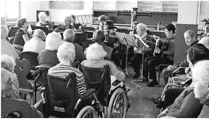
aufmerksam genießen: Kommt bald wieder!