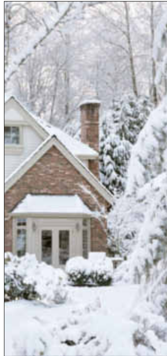
Winterwetter setzt Immobilien kräftig zu.

Lüften ist unentbehrlich im Winter. Auch an extrem eisigen Tagen muss Frischluft ins Haus, damit alte, feuchte Luft entweichen kann. Statt Dauerlüften mit gekipptem Fenster, empfehlen Fachleute mehrmals täglich Stoßlüften. Und zwar immer fünf bis zehn Minuten lang, am besten auf Durchzug. Das entsorgt die Feuchtigkeit und optimiert die Energieausbeute, denn nur frische, trockene Luft erwärmt sich