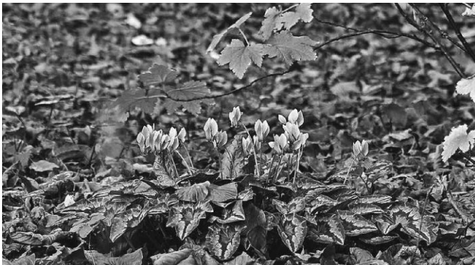
Alpenveilchen, Bild: KRiemer-Pixabay

diese Wochen werden im Kirchenjahr Epiphania-Zeit genannt: „Erscheinungszeit“. Nachdem das Kind in Bethlechem geboren ist, wird es zunächst einige Zeit still um Jesus. Vom ersten öffentlichen Auftritt Jesu erzählt das Lukasevangelium (Lk 2, 41ff): Der 12jährige Jesus sitzt mitten unter den Gelehrten im Tempel. Erst nach einem erneuten, großen Zeitsprung wird die Taufe Jesu durch Johannes berichtet. Somit bleibt ein langer Zeitraum (Kindheit, Jugend und Erwachsenwerden) von Jesu Biographie im Dunkel. Dies hat natürlich einige Schriftsteller zu eigenen Erzählungen motiviert. Die bekannteste ist das „Kindheitsevangelium nach Thomas“. In recht abenteuerlichen Episoden wird unter anderem von einem wundersamen Jesus-Kind „berichtet“, das aus Lehm Vögel formt und sie lebendig macht. Diese Schrift hat allerdings keinen Eingang in die Bibel gefunden; sie ist einfach zu grotesk und ohne tieferen Sinn. So ist – wie im Leben auch – manchmal einfach nur Abwarten und Geduld gefragt, bis die Dinge kommen und sich entfalten.