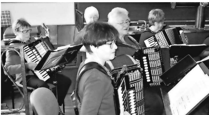
Glück lässt sich verdoppeln,