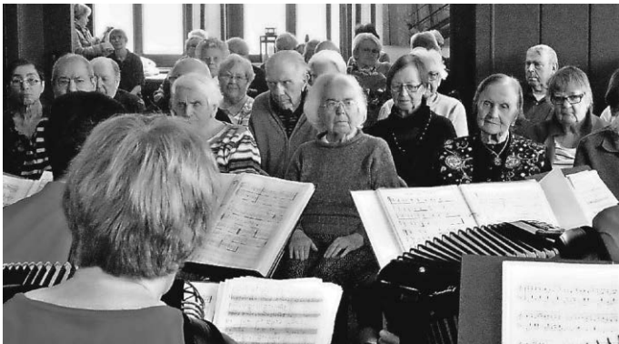
wenn man es teilt. (Albert Schweitzer)

Mit einem herzlichen „ Dankeschön “ verabschiedeten sich die Bewohner von dem Orchester und den helfenden Händen. Nach dem Konzert durften sich dann alle Akteure noch mit Kaffee, Kuchen und Butterbrezeln vom Förderverein bei anregenden Gesprächen stärken. Danach machte sich das Orchester wieder auf den Heimweg. Alle riefen hinterher: „ Kommt bald wieder! “