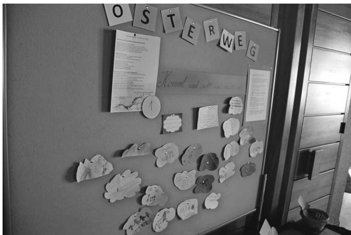
Osterweg einfach anders und zum Mitmachen

Die Seelsorgeeinheit Bussen und die Dekanate Biberach und Saulgau laden am Samstag, 13. März 2021 von 17 bis 19 Uhr in die Wallfahrtskirche auf dem Bussen zu einer „Segenszeit“, besonders für Menschen in Verantwortung, ein. Jede*r ist willkommen! Kommen und gehen, wann man möchte. Die Segenszeit endet mit einer kurzen Andacht. Eine Anmeldung ist nicht erforderlich, aber es werden die Daten erfasst.