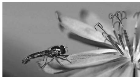
Wegwarte mit Schwebefliege

Die Wegwarte trägt als deutschen Beinamen die Bezeichnung „Arme-Sünder-Pflanze“.