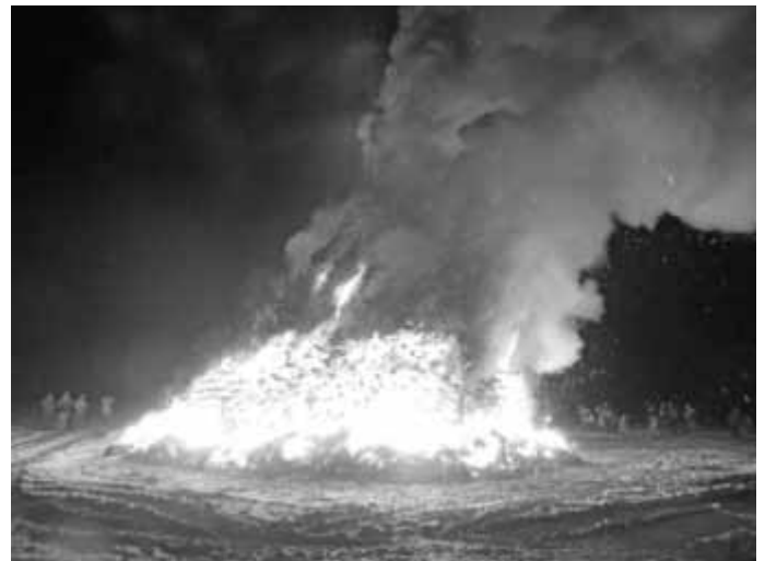
Funkenfeuer in Birkenhard

Herzlichen Dank den Jugendlichen der Bude Galmuthshöfen und Brauchtumsfreunde Birkenhard und allen anderen Helfern für die schönen Funken. Für das Abbrennen der Funken herrschte optimales Wetter, was auch durch den guten Besuch der Bevölkerung honoriert wurde.