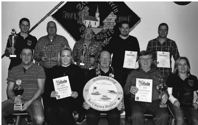
Schützenkönig, Pokalgewinner & langjährige Mitglieder

Preis aussuchen. Weitere Infos, Bilder und alle Ergebnislisten auf www.schuetzenverein-birkenhard.de .