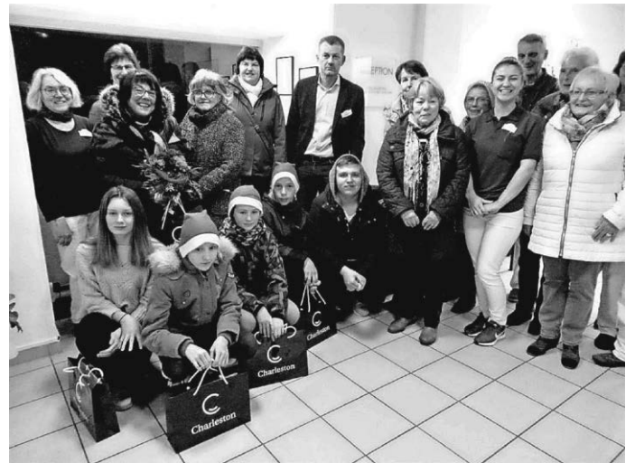
Ehrenamtliche und Profis - mit den Hoffnungsträgern von morgen

Nach der Feier, bei frostiger, aber trockener Witterung, machte sich Santa Claus und sein Begleiter mit der Rute noch auf zum Besuch der Gebrechlichsten in den Wohngruppen und entschwandten dann wieder. Im kommenden Jahr werden sie erneut gerufen. Es war wieder mal eine gelungene Nikolausfeier, die allen Beteiligten lang im Gedächtnis bleiben wird. Hoffen wir, dass das Wetter auch in 2020 ein Einsehen hat, denn so ein Treiben unter freiem Himmel bietet doch immer ein besonderes, wenn auch erfrischendes Flair.