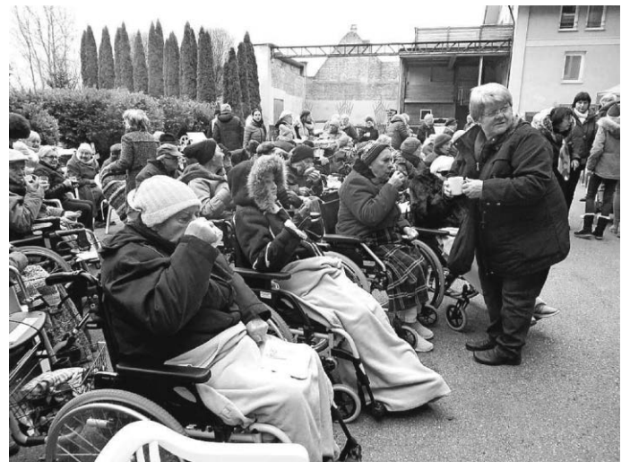
Gestärkte Seniorinnen und Senioren warten auf den Nikolaus