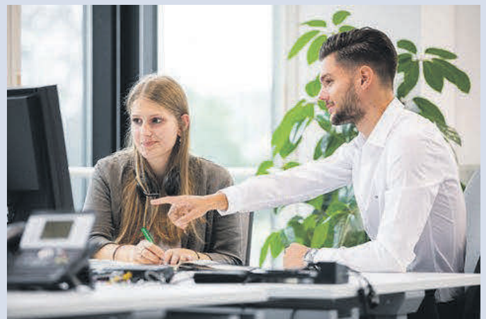
Die künftigen Vertriebstalente im Außendienst sind gefragt und die Entwicklungsperspektiven ausgezeichnet.

PHYSIOTHERAPIE // GERÄTETRAINING // KURSE Birkendorferstr. 42, 88400 Biberach, Tel. 07351/5772297 info@therapiezentrum-gerster.de // www.therapiezentrum-gerster.de