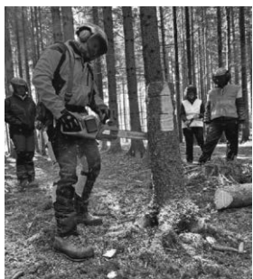
Im Auffrischungslehrgang lernen die Teilnehmenden unter anderem die Schnittführung mit der Motorsäge.

Das Kreisforstamt bietet zum sicheren Umgang mit der Motorsäge einen Auffrischungslehrgang an. Der Kurs richtet sich an Interessierte, die bereits einen Motorsägen-Grundlehrgang belegt haben und ihre Fertigkeiten und Kenntnisse in der Holzernte auffrischen und vertiefen möchten. Das Kreisforstamt bietet für Waldbesitzerinnen und Waldbesitzer einen Auffrischkurs zum fachgerechten Umgang mit der Motorsäge an. Kursinhalte sind: Demonstration des Akkufällkeils, Üben der Fäll- und Schneidetechniken und das sichere Fällen von Bäumen. Der Auffrischkurs ist auf zehn Personen beschränkt. Er findet eintägig am Donnerstag, 9. November 2023 von 8 bis circa 16.30 Uhr statt. Der Kurs kostet 80 Euro. Die Teilnehmerinnen und Teilnehmer des Kurses werden gebeten, eine komplette persönliche Schutzausrüstung bestehend aus Schnitthose, Schnitthandschuhen, Arbeitsschuhen, Helm mit Gehörschutz und Gesichtsschutz und einen Nachweis über eine private Unfallversicherung oder die Mitgliedschaft in der Landwirtschaftlichen Berufsgenossenschaft (SVLFG) mitzubringen.