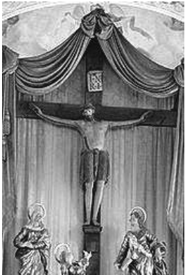
Bild Herrgöttle von Biberbach

Das „Herrgöttle von Biberbach“ ist ein großes hölzernes Kruzifix aus dem 13. Jahrhundert, das in der Wallfahrtskirche St. Jakobus, St. Laurentius und zum Heiligen Kreuz in Biberbach, einem Markt im Landkreis Augsburg, bewahrt wird. Das vielbesuchte Gnadenbild hatte aufgrund seiner beachtlichen Größe (Größe des Kruzifixus: 2,12 m, Armspannweite 2,07 m) vermutlich als Triumphkreuz in einer größeren Kirche des benachbarten Württemberger Raumes Verwendung gefunden und ist der Romanik zuzuordnen. Danach wurde das Kruzifix im Rahmen der Reformation von Bilderstürmern aus einer Kirche im Württemberger Raum entfernt und achtlos liegengelassen. Ein katholischer Weinhändler fand das Bildnis, versteckte es unter einer Plane auf seinem Wagen und nahm es mit. In Biberbach – so die Überlieferung – verweigerten die Zuggpferde im Jahre 1525 am Kirchberg ihren Dienst und ließen sich erst nach dem Abladen des Kreuzes zum Weiterlaufen bewegen (das sogenannte „Gespannwunder“).