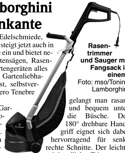
Rasen-trimmer und Sauger mit Fangsack in einem.

Wer jetzt auch bei der Gartenarbeit nicht auf das Tonino Lamborghini verzichten möchte, kann z.B. mit den Rasentrimmern sehr stylisch seine Rasenkanten pflegen. Der neue Erster am Gartenhimmel ist hier als Weltneuheit tritt der Trimmer und Sauger mit Fangsack in einem, für Kanten, Terrassen und Rasenflächen seinen Dienst an und das Gras im Beet gehört der Vergangenheit an. Mit der 3-Punkt-Schnittwinkelverstellung