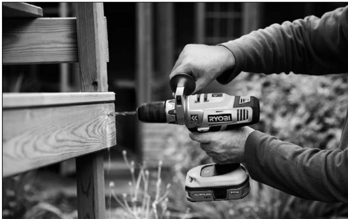
So viel Komfort gab's noch nie beim Bohren und Schrauben: Der intelligente 18 Volt Akku-Bohrschrauber wählt selbständig immer den richtigen Gang.