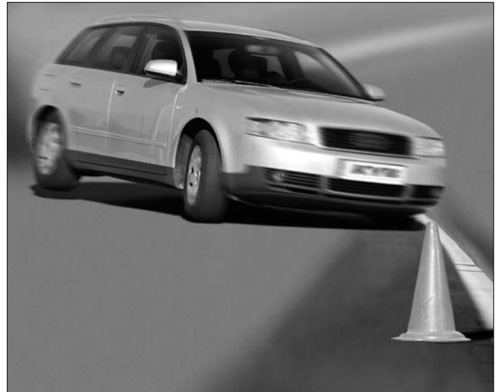
Wenn das Auto zum Flugzeug wird: Müde Stoßdämpfer schaffen es nicht mehr die Räder auf der Straße zu halten.

Grafik: Centro