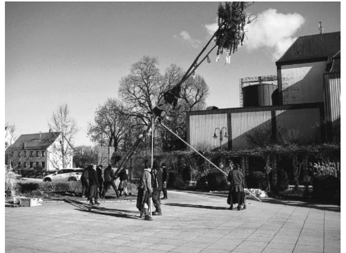
Der Narrenbaum fällt, die Fasnet ist zu Ende!

Zum Schluss gilt unser Dank natürlich auch allen Vereinsmitgliedern, für die rege Teilnahme an den Veranstaltungen. Wir freuen uns schon auf die Saison 2019!