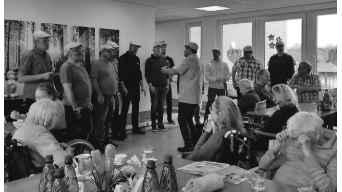
Bräschdleng im Pflegezentrum

rinnen und Bewohner war anzusehen, dass ihnen dieses Konzert der Bräschdleng sichtlich große Freude bereitet hat. Der Förderverein bedankt sich an dieser Stelle noch einmal sehr herzlich bei den Bräschdleng für ihren Auftritt im Pflegezentrum. Ein lieber Dank gilt auch allen Helferinnen und Helfern für die Vorbereitung und Durchführung der Veranstaltungen.