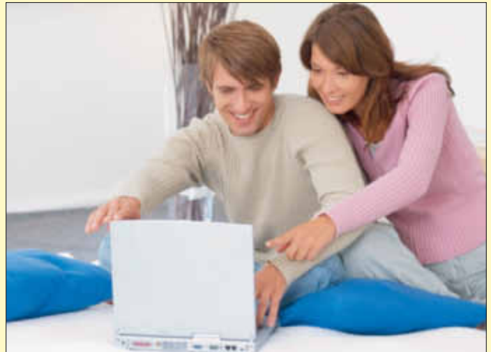
Vorsicht bei der Urlaubsbuchung im Internet: Schnäppchen sind nicht immer günstig!