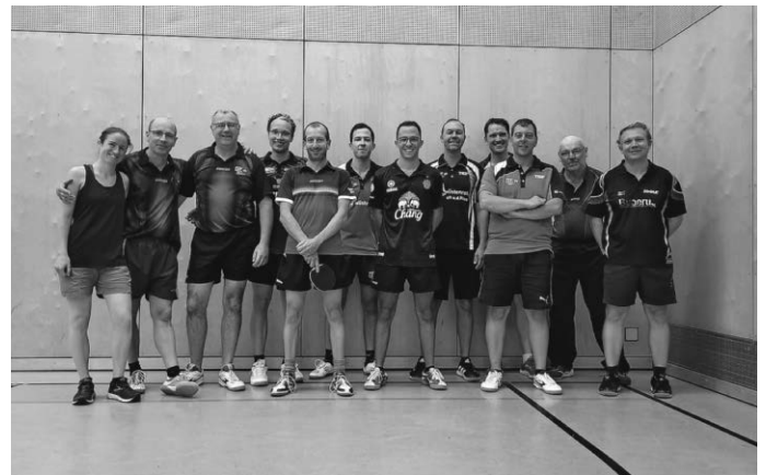
Teilnehmer der Vereinsmeisterschaften