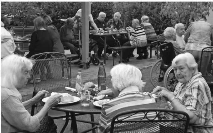
dankbare Bewohner mit beachtlichem Appetit.