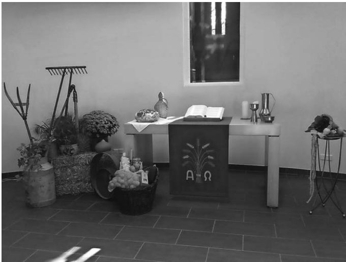
Erntealtar in Warthausen.

Solche dankbaren Momente und Erinnerungen braucht es. Gerade dann, wenn nicht alles im Leben in Ordnung ist. Wenn es an Gesundheit oder an persönlichem Frieden fehlt; wenn es an Geld oder Perspektive mangelt. Es braucht die dankbare Erinnerung daran, dass Gott es gut mit uns meint. So finden wir den Mut auch die Herausforderungen der Gegenwart anzupacken und zu bestehen. Denn letztlich meint es Gott mit uns gut.