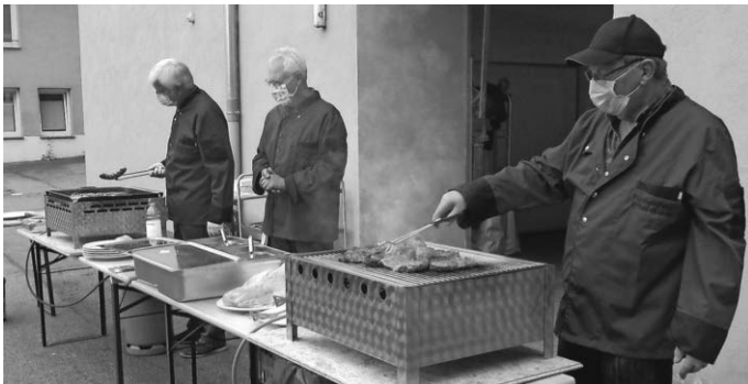
Grillprofis bei der Arbeit und ...

Hoffen wir alle, dass die kommenden Jahreszyklen wieder mehr unbeschwerte Nähe und Wärme bringen und sich dann auch alle angedachten Feste, Feiern und Ausflüge wieder realisieren lassen.