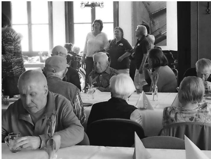
... und gemeinsam sich die Zeit versüßen.