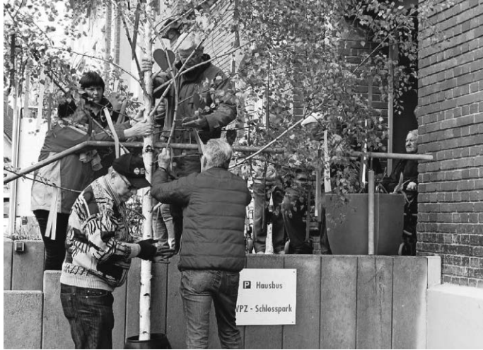
Das Bäumchen richten, den Frühling grüßen ...

Bis bald also: Der nächste Mai wird kommen und alle werden wieder dabei sein!