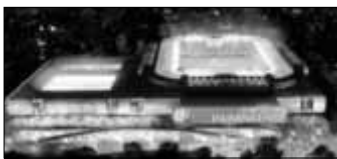
Curitiba Zuschauer: 41.456