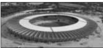
Belo Horizonte Zuschauer: 62.547