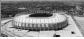
Fortaleza Zuschauer: 64.846