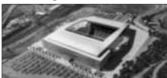
Sao Paulo Zuschauer: 65.807