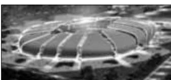
Natal Zuschauer: 42.086