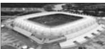
Recife Zuschauer: 42.849