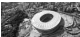
Salvador Zuschauer: 48.747