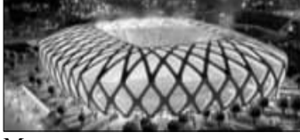
Manaus Zuschauer: 42.374