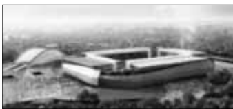
Cuiaba Zuschauer: 42.968