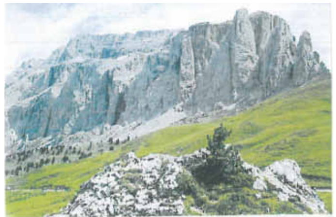
Sellastock von Westen

Die diesjährige 3-Tagesbergtour geht auf die Dolomiten-Sellagruppe. Am 1. Tag Anreise und Bergwandern um die Cirspitzen am Grödnerjoch, Übernachtung im Berggasthof Grödnerjoch (Betten). Am 2. Tag steigen wir gemeinsam vom Grödnerjoch (2121m) über einen Wandersteig als auch dem Pisciadu'-Klettersteig hoch zur Pisciadu'-Hütte (2585m), nach einer Einkehr geht es weiter über den Sellastock zum 2. Nachtlager, (Gruppenlager) zur Boe'-Hütte (2833m). Am 3. Tag Aufstieg auf den Piz Boe' (3152 m üM.), leichtest begehbarer Dreitausender der Dolomiten, Panorama-Einkehr am Gipfel, danach Abstieg zur Seilbahn nach Corvara, Bustransfer zum Grödnerjoch, Heimreise. Voraussetzung: Schwindelfrei, min. 6 Std. Ausdauer mit Rucksack und Gute Laune! Teilnehmer sind begrenzt! Anmeldung umgehend, wegen Hüttenreservierung, Abfahrt am Donnerstag 31.08.2017, 6.00 Uhr früh, Raiba Warthausen, Anmeldung und Fragen zur Tour, telefonisch an mich, Josef Ebenhoch, Handy.: 0170/7328283