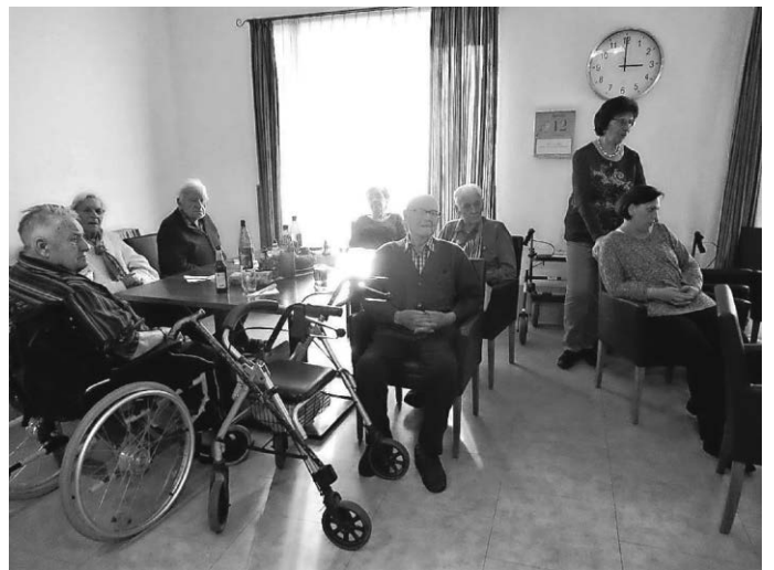
Wie uns die Alten sangen ... von wundersamer Art ...