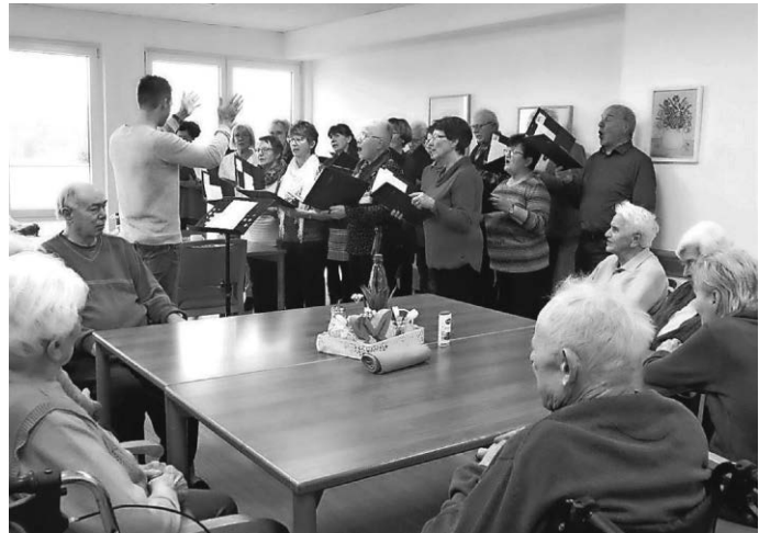
Es ist ein Ros' entsprungen ... aus einer Wurzel zart ...

Der Förderverein dankt nochmals dem Kirchenchor für sein regelmäßiges, selbstloses Mitwirken bei seinen Bemühungen, die betagten Mitbürger am Zyklus der kirchlichen und weltlichen Jahreszeiten teilhaben zu lassen.