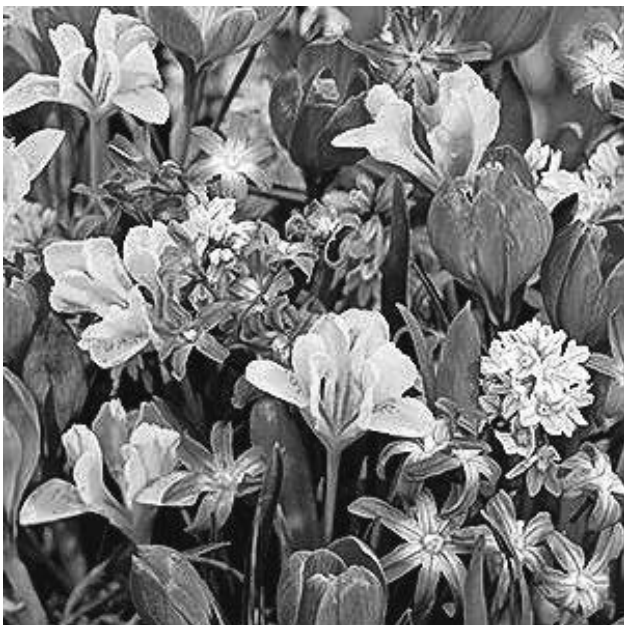
Das Frühjahr kommt