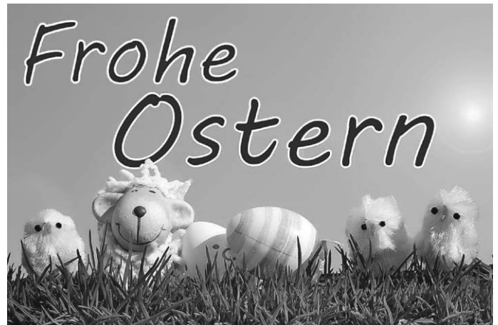
Der Osterhase ist da.