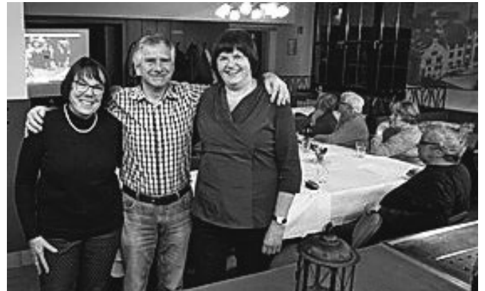
Wir freuen uns auf Euch !

Über eine rege Beteiligung würden wir uns sehr freuen.