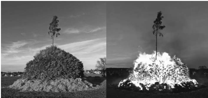
Fertig zum Abbrennen

Auf Grund des Sturms haben wir aus Sicherheitsgründen das aufgebaute Funkenfeuer nicht wie vorgesehen am Funkensonnntag abgebrannt. Am vergangenen Samstag konnten wir nun bei deutlich besserer Witterung das Funkenfeuer abbrennen.