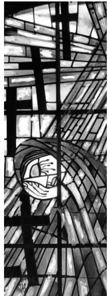
Ehrenmal für die gefallenen Schüler des Städtischen Gymnasiums, Gummersbach

Die Bevölkerung ist herzlich eingeladen.