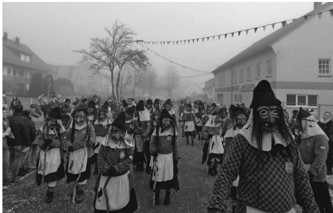
Gurra beim Umzug von Schemmerhofen

Am Sonntag, 04.02. sind wir beim Umzug in Eberhardzell. Umzugsbeginn: 13:30 Uhr. Laufnummer: 45, Treff am Aufstellungsplatz wird noch bekannt gegeben. Nach Eberhardzell fährt kein Bus.