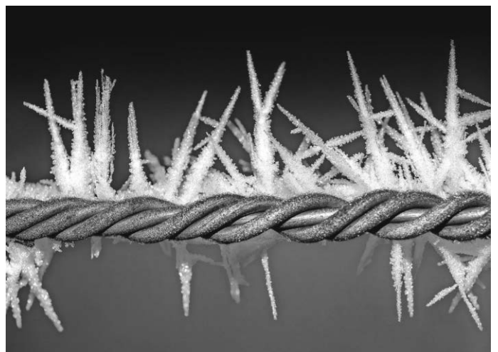
Drahtzaun im Winter - mit „Winterblüten“

Ja, auf dieser Welt gibt es Grenzen. Und manche Abgrenzungen sind notwendig und verwaltungstechnisch auch erforderlich. Manche Grenzen bestehen seit vielen Jahrzehnten und gelten inzwischen als selbstverständlich. Dennoch sind sie immer etwas Vorläufiges und darum fragwürdig: Muss die Grenze sein? In Europa machen wir seit vielen Jahrzehnten die gute Erfahrung, dass Grenzen immer durchlässiger werden. Für mich beispielhaft: Die Grenze zwischen Deutschland und Frankreich. Nach drei furchtbaren Kriegen wurden 1871, 1918 und 1945 die Grenzlinien jeweils neu gezogen. Und nach einer segensreichen Geschichte der Versöhnung wurde in den letzten Jahren viel an Vertrauen und Gemeinsamkeit aufgebaut und der Grenzübertritt ist heute kaum noch spürbar.