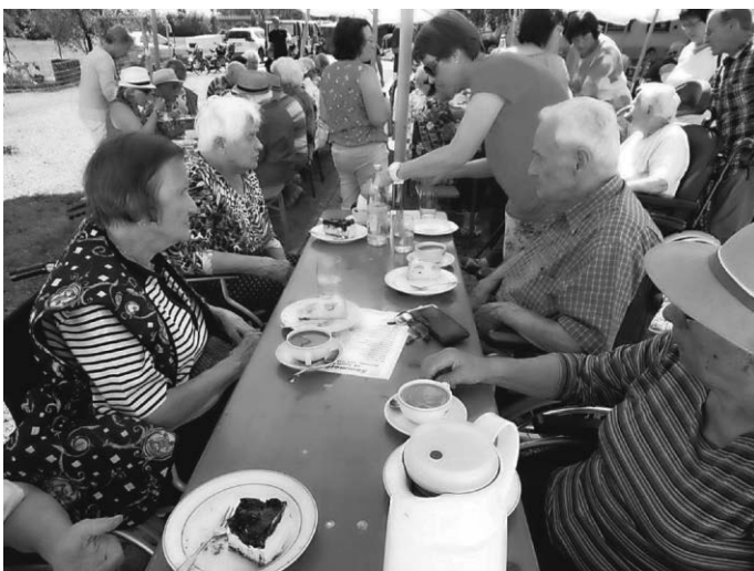
... Bewirtung: toll!