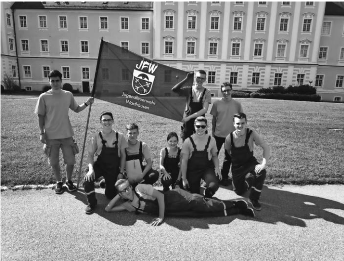
Teilnahme der Jugendfeuerwehr an der Stadtrallye