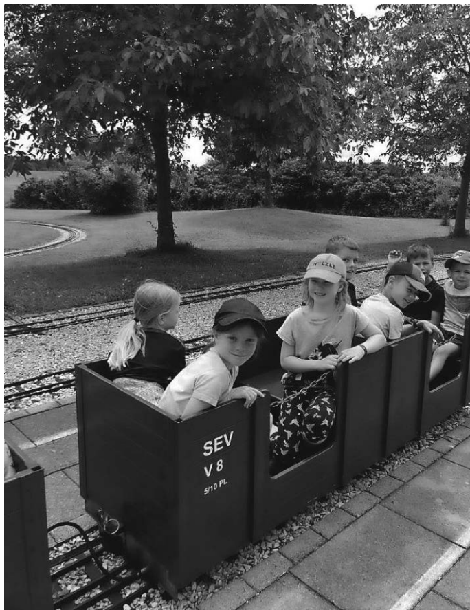
Kindergruppe in Kürnbach