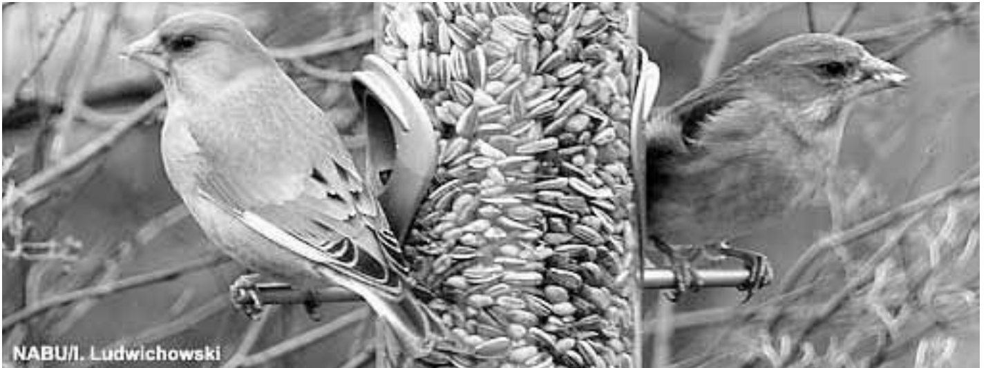
Grünfinkenpaar am Futterautomat.