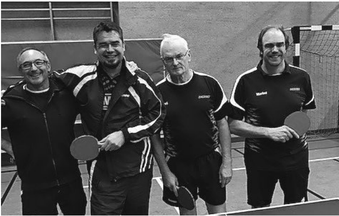
4. Mannschaft des SVB