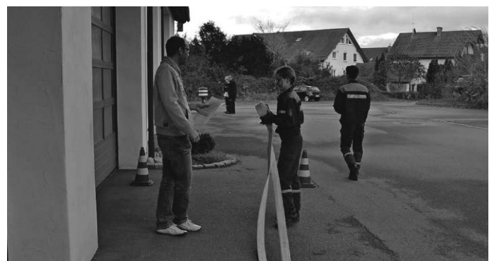
Auswerfen eines Feuerwehrschauches

Alle angetretenen Teilnehmer bestanden die Abnahme.