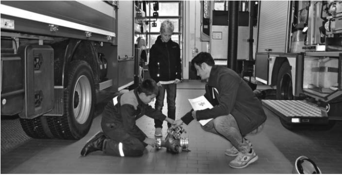
Abfrage der Theorie