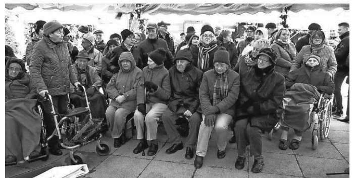
Eingemummt und eng beisammen ...

Da fällt mir sinngemäß wieder ein Spruch von Hermann Hesse ein, der auch Leitgedanke aller Aktionen des Fördervereins ist: „Wenn wir einen Menschen glücklich und heiter machen können, so tun wir es, auch wenn er nicht darum bittet“.