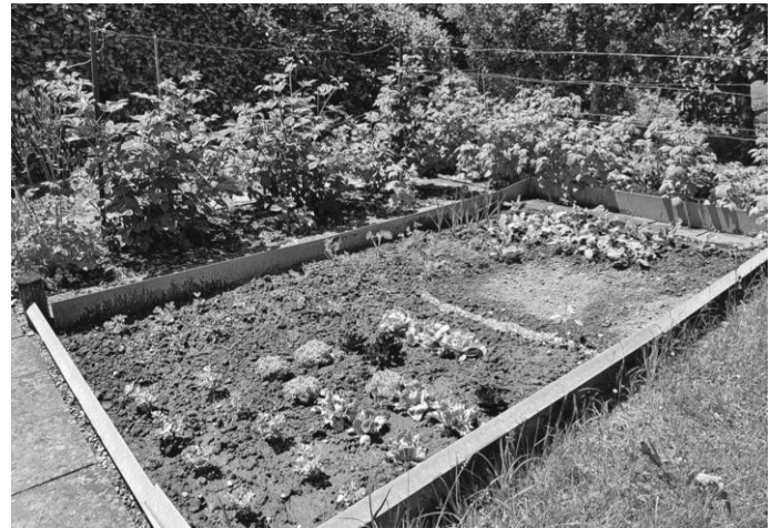
Hoffentlich gibt es dieses Jahr eine erfolgreiche Ernte.