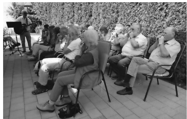
Bezaubernde Klänge ...

Hernach lud der Förderverein alle Akteure noch in den Wack'ren Schwaben. Gemeinsam ließen die Musikanten, zusammen mit den helfenden Händen, diesen wunderschönen Nachmittag bei Kaffee, Kuchen und anregenden Gesprächen ausklingen.