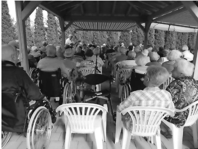
... verzauberte Ränge!