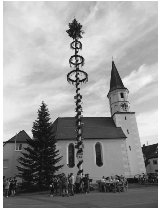
Ein gelungener Maibaum 2024

... an alle, die sich in irgendeiner Form beim Maibaum 2024 engagiert haben. Gemeinsam haben wir wieder einen sehr schönen Maibaum gestaltet, der am letzten Apriltag vor der alten Kirche in Birkenhard gestellt wurde. Gefreut haben wir uns über die zahlreichen Zuschauer und Besucher, mit denen wir zusammen den Maibaumstelltag ausklingen ließen. Die unter dem Maibaum aufgestellten Bänke und Tische sollen zum Verweilen einladen und dürfen von jedem genutzt werden. Wünschen wir uns allen nun, dass das Maiwetter entsprechend mitspielt und sich unser Maibaum zu einem Mai-Treffpunkt entwickeln wird. Bitte alles Mitgebrachte wieder mitnehmen und den Kirchplatz sauber verlassen - Danke.