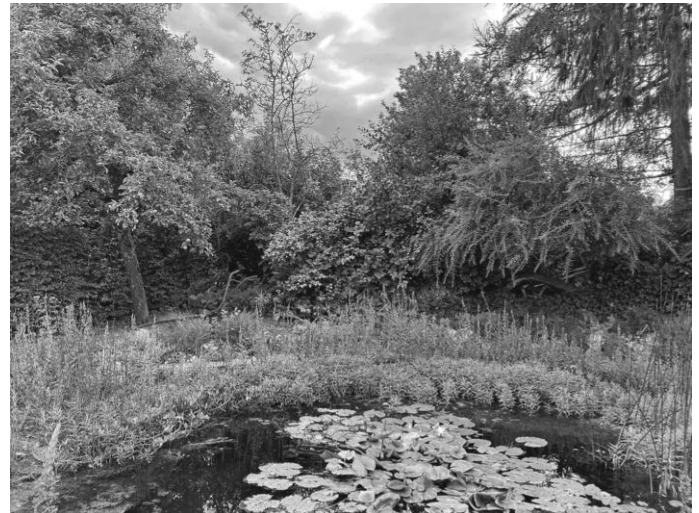
Der Landkreis Biberach zeichnet auch 2024 wieder Naturgärten aus. Anmeldeschluss für den Wettbewerb ist Montag, 3. Juni 2024.

Die Jury besucht die besten 30 Gärten am Dienstag, 11. Juni 2024 persönlich, woraufhin zehn Gewinner ermittelt werden. Diese erhalten eine Plakette, die den Garten als Biberacher Naturgarten ausweist. Anmeldeschluss für den Wettbewerb ist Montag, 3. Juni 2024.