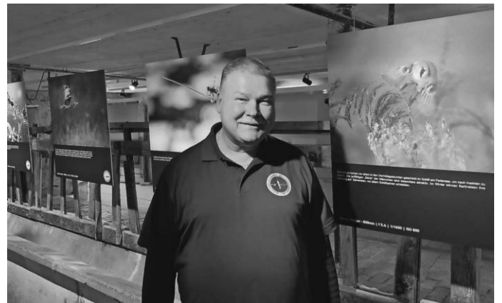
In einer Multivisionsschau mit dem Naturfotografen Thomas Muth erfahren Museumsgäste am Sonntag, 12. Mai um 15 Uhr im Museumsdorf Kürnbach, wie spannend die Arbeit eines Naturfotografen ist.

Am Sonntag, 12. Mai um 15 Uhr präsentiert Thomas Muth im Oberschwäbischen Museumsdorf Kürnbach in einer Multivisionsschau mit beeindruckenden Fotografien und Geschichten das Projekt „Naturjuwelen Oberschwabens“. Der Laupheimer Thomas Muth, Initiator des Fotoprojekts „Naturjuwelen Oberschwabens“, gibt in seiner Multivisionsschau im Tanzhaus des Museumsdorfs spannende Einblicke in die Arbeit von Naturfotografinnen und -fotografen: Interessierte entdecken mit dem Blick durch die Kameralinse des Fotografen die Magie des Wassers, geheimnisvolle Moore und den Zauber des Waldes.