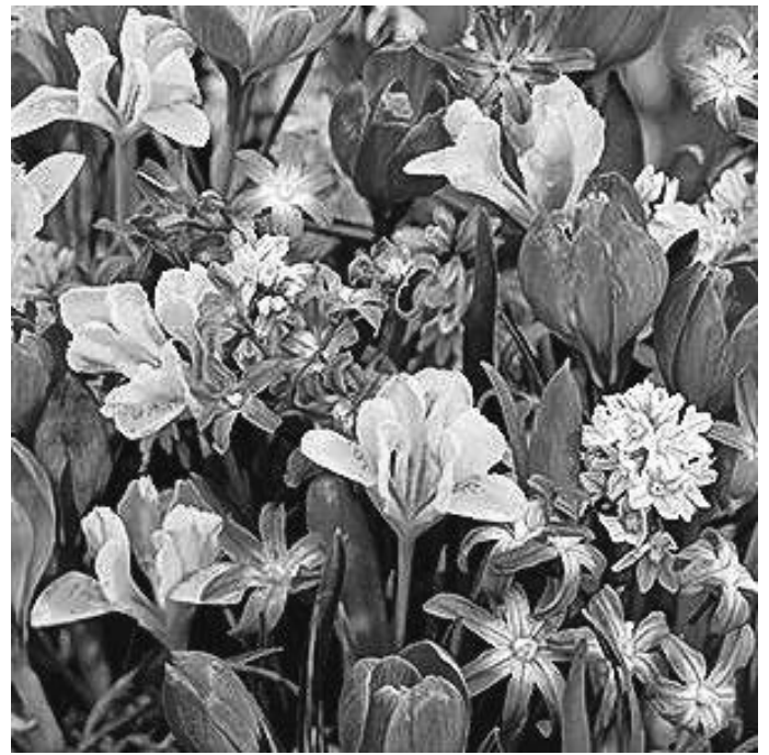
Es wird Frühling