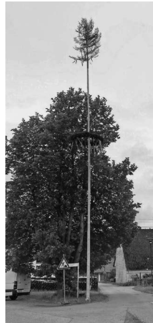
Maibaum in Barabein

Auf den Fotos sind die wunderschön hergerichteten Maibäume abgebildet.