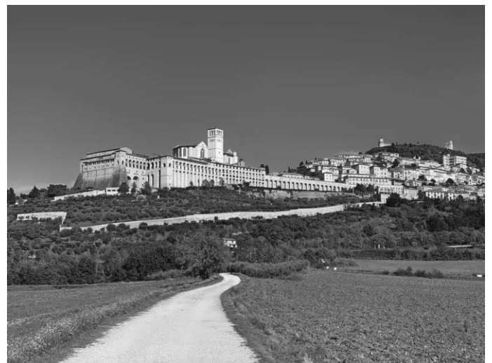
Teil des Franziskusweg