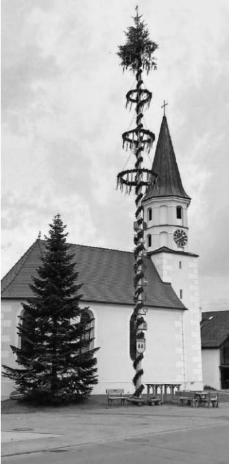
Maibaum in Birkenhard

Wie in den zurückliegenden Jahren wurde in Warthausen und in den Ortsteilen Birkenhard, Galmutshöfen und Barabein die Tradition des Maibaumstellens aufrechterhalten.