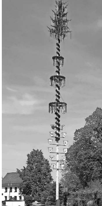
Maibaum in Warthausen