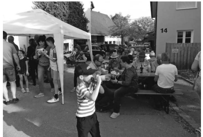
Nach dem Maibaumstellen war ein gemütlichen Maibaumhock angesagt

Aktuelle Informationen sind auch auf unserer Internetseite www.brauchtumsfreunde-birkenhard.de zu finden.