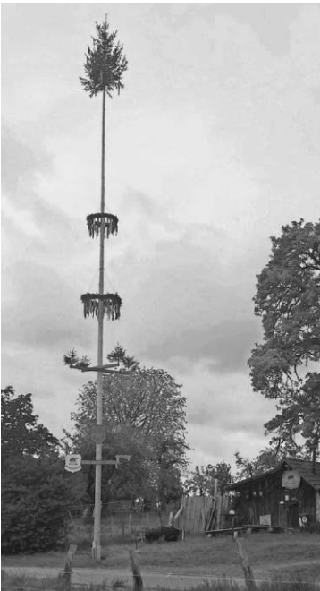
Maibaum in Galmutshöfen