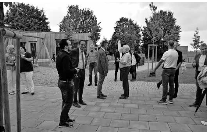
Besucher und offizielle Gäste im Garten der Kindertagesstätte