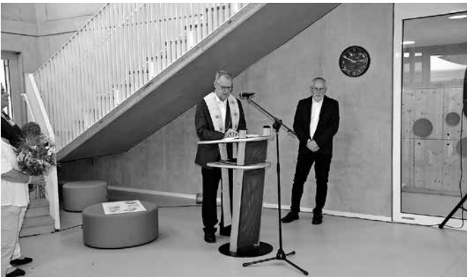
Kirchliche Einweihung der Kindertagesstätte