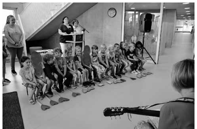
Aufführung der Kindergartenkinder