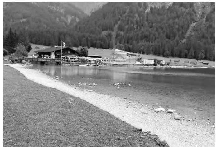
Alpen und See