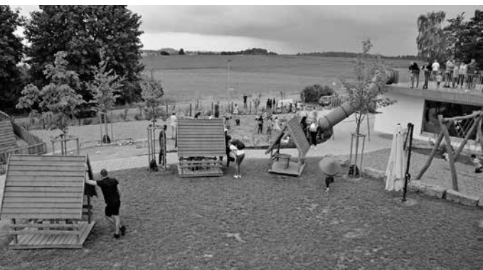
Spielplatz im Außenbereich der Kindertagesstätte