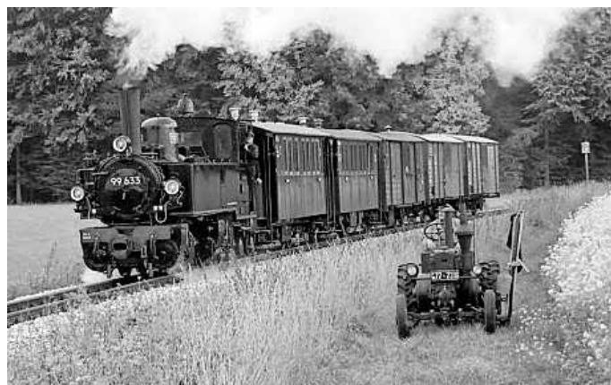
Fahrt mit dem Öchsle