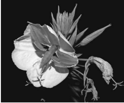
Bild: Nachtkerze