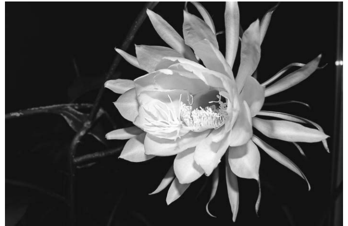
Königin der Nacht, Wellensittich-Pixabay

Die Königin der Nacht: Selenicereus grandiflorus - wie der Name verrät hat dieser Kaktus eine große Blüte (grandiflorus) mit bis zu 30 cm Durchmesser, die nur nachts blüht (selene, griechisch „Mond“). Warum nachts? Weil Fledermäuse für die Bestäubung der wohlriechenden Blume zuständig sind. Insbesondere die Blüte ist sehr vergänglich, manchmal blüht sie nur eine Nacht lang. Früher war der Kaktus häufig auf heimischen Fensterbänken zu sehen.