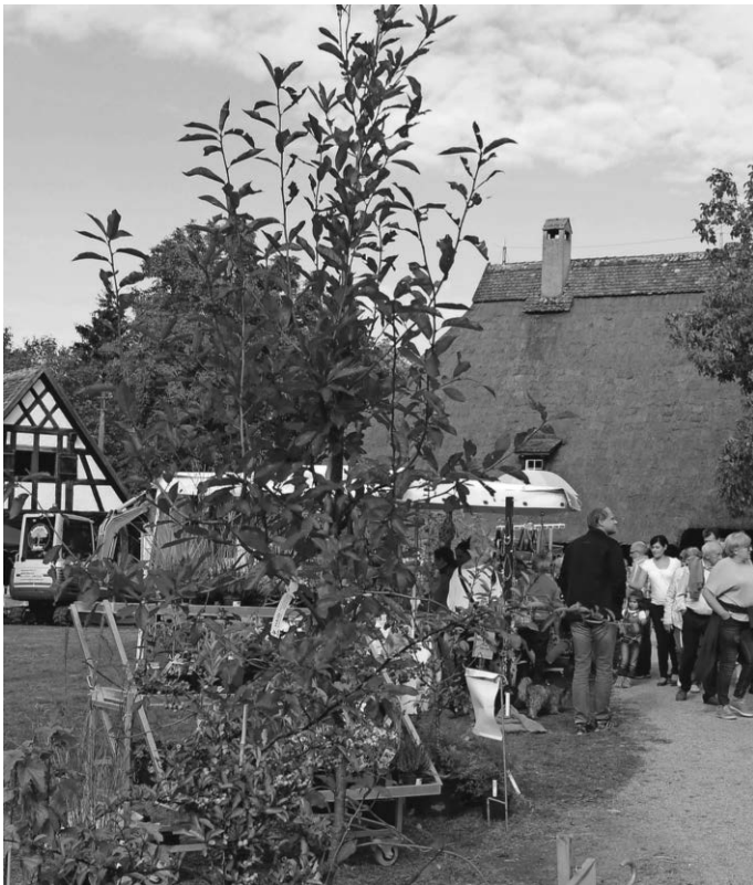
Die Apfelsausstellung beim Kürnbacher Herbstmarkt am Sonntag, 2. Oktober lockt mit über 250 historischen Sorten, wie der Gewürzluke oder dem Jakob Fischer.

die viele noch aus ihrer Kindheit kennen, können Interessierte spannende Informationen über die Geschichte des Obstanbaus in Oberschwaben entdecken. Dabei darf natürlich der berühmte Jakob Fischer nicht fehlen.